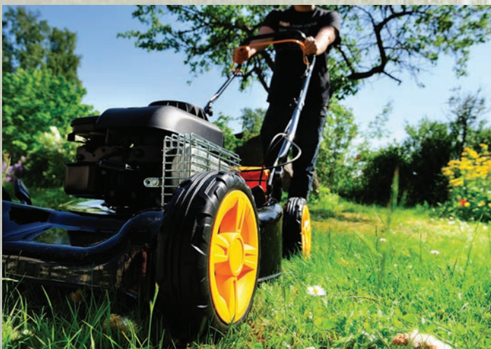
Oman osaamisen myyminen on kevytyrittäjyyden peruskivijalka.

Esimerkki: Olet kevytyrittäjä ja tarjoat nurmikonleikkupalveluita vanhuksille. Käyt leikkaamassa Irma-tädin pihamaalta ruohot ja työt tehtyäsi kerrot, että lasku saapuu perästä. Tämän jälkeen kirjaudut käyttämäsi laskutuspalvelun verkkosivuille ja täytät laskun tiedot: mitä tehtiin, kenelle ja mihin hintaan? Tämän jälkeen laskutuspalvelu lähettää laskun Irma-tädille. Kun Irma maksaa laskun, laskutuspalvelu ottaa välistä pienen palkkion (esim. 5% summasta) ja tilittää jäljelle jääneen summan sinulle.